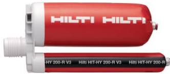
HIT-HY 200-R V3