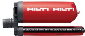
HIT-HY 200-A V3