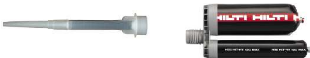
ミキシングノズル部